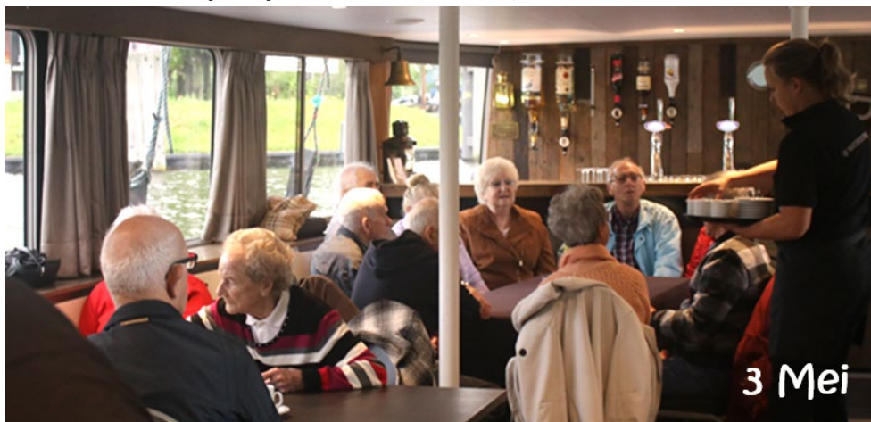
Even 'n rondje tijdens de koffie pauze